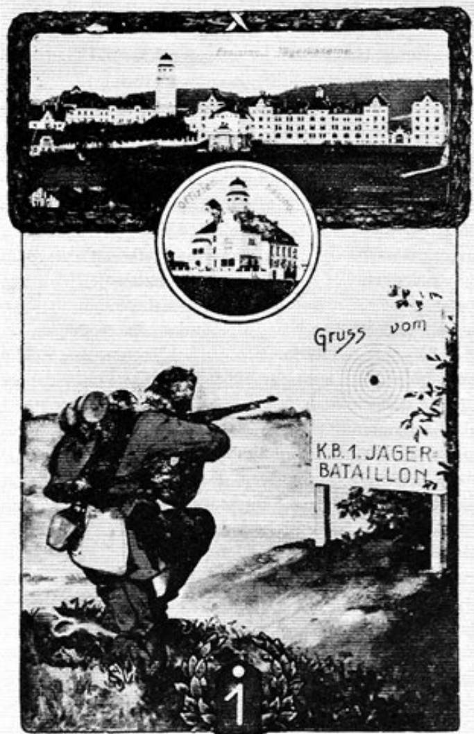
Abb. 4: Jägerkaserne, jetzige Vimykaserne in Freising zwischen 1906 und 1914.