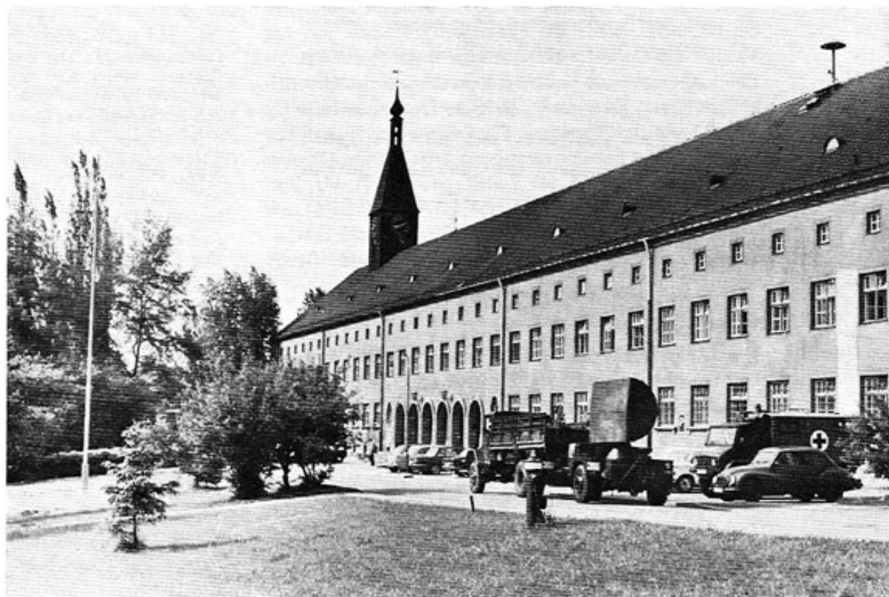
Abb. 5: General-von-Stein-Kaserne 1970.