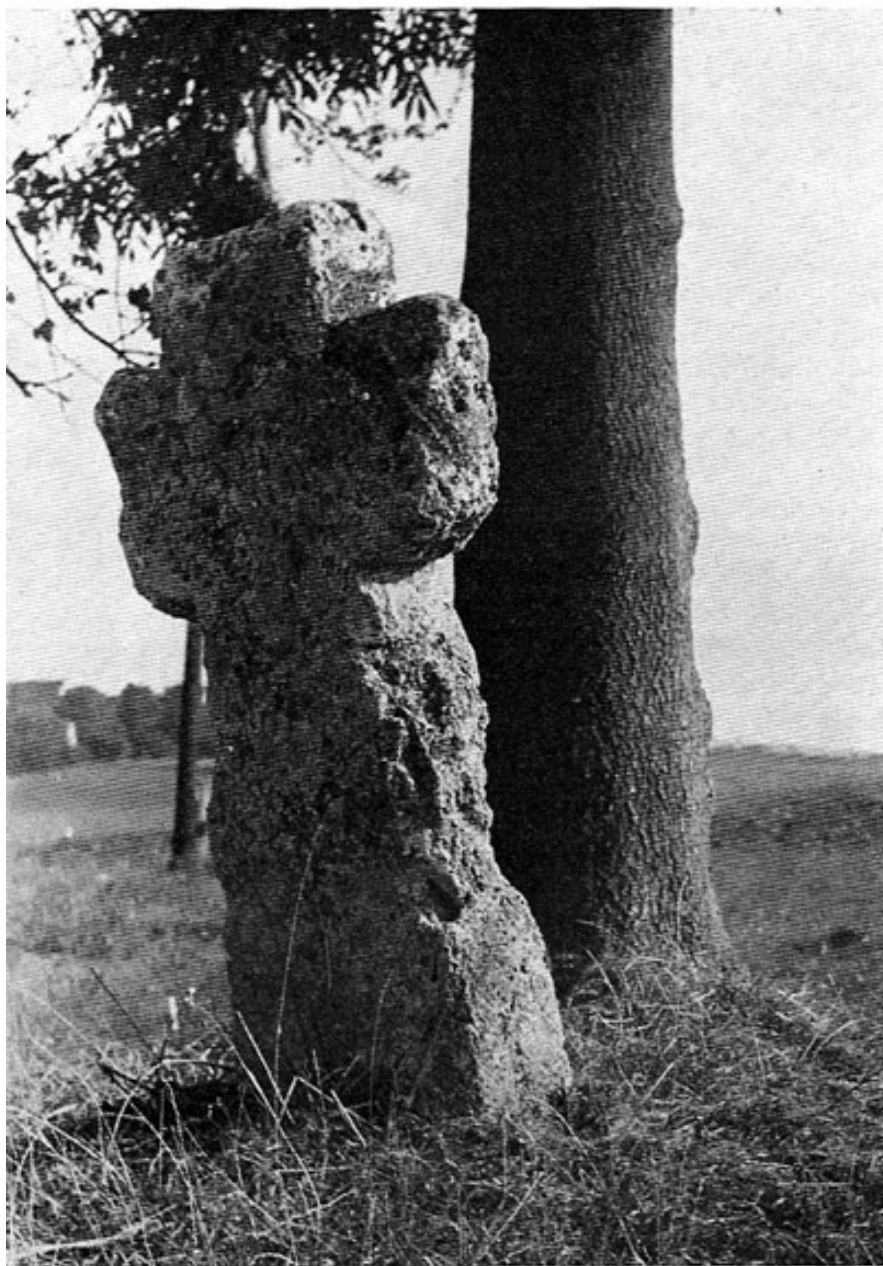
Steinkreuz bei Unterschweinsbach