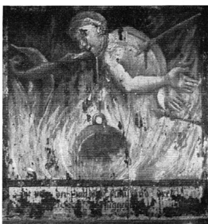
Abb. 2: Zwölftes Bild des »Höllensbildes« in Niederhummel.