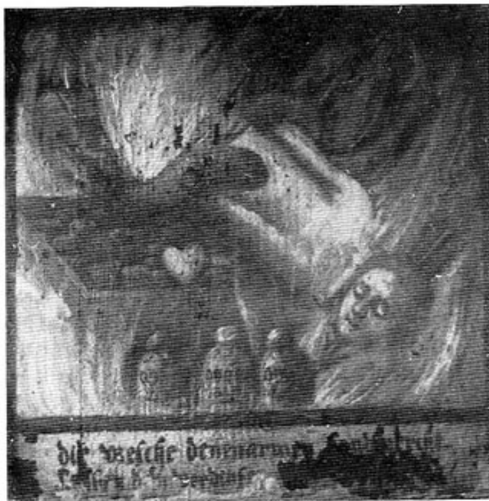
Abb. 3: Dreizehntes Bild des »Höllensbildes« in Niederhummel.

1. Bild: Jüngstes Gericht. Christus sitzt mit erhobener Hand auf dem Regenbogen; neben ihm knien links und rechts Maria und Joseph (!). Engel mit Posaunen wecken