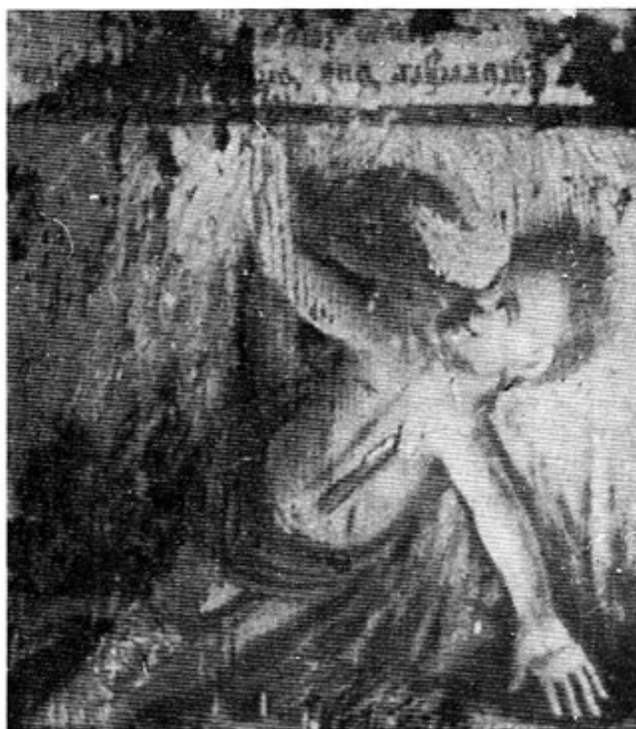
Abb. 4: Vierzehntes Bild des »Höllenbildes« in Niederbummel.