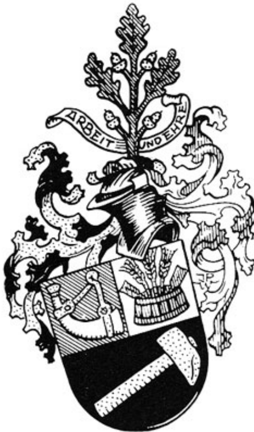
Wappen der Familie Hörhammer