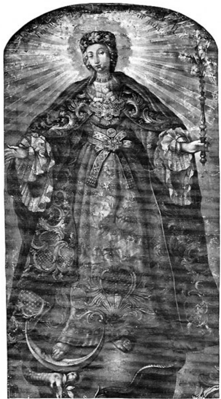
Gnadenbild der Freisinger Inmakulata (Schabild im Freisinger Heimatmuseum).