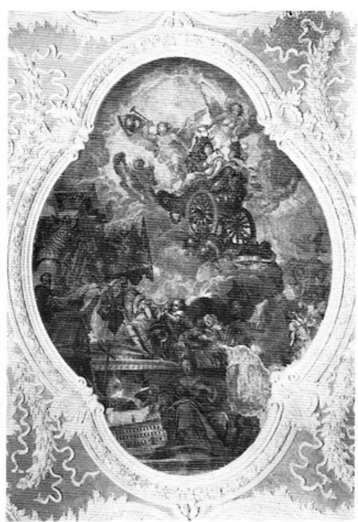
Hans Georg Asam: Virtus et Scientia — Deckengemälde im Asamsaal in Freising.

Für die Laufzeit des Vertrages hatte die Stadt mit dem Kinoinhaber vereinbart, daß die Stadt und die hiesigen Schulen für jeweilige Festveranstaltungen sowie die Asamgemeinde für Theateraufführungen und Konzerte das Benutzungsrecht haben. Als nach zehnjähriger Laufzeit der Vertrag endete, wurde der Saal wieder seinem eigentlichen Zweck zugeführt.