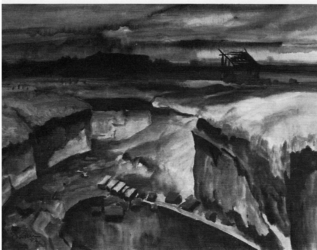
Hermann Böcker: Nacht am Moor- tümpel, Aquarell 1952, 55 x 74 cm.