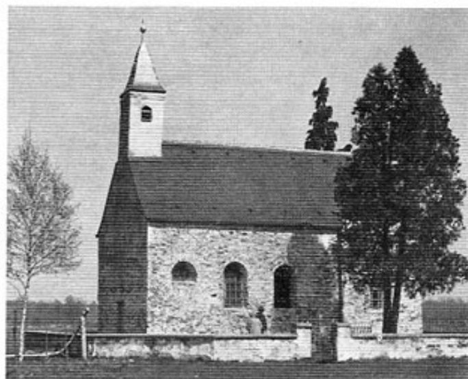
Abb. 1: Seitenansicht der Kapelle nach Entfernung des alten Außenputzes. Zustand April 1971.

Die Reste der keltischen Bevölkerung, die zurückgebliebenen Romanen und die zugewanderten Germanen schlos-