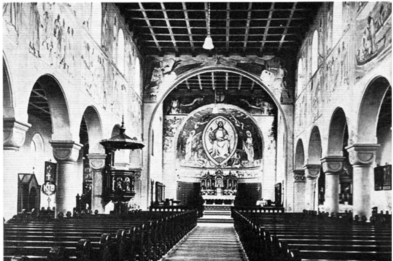
Das Innere der neuen Pfarrkirche St. Peter und Paul von Olching.