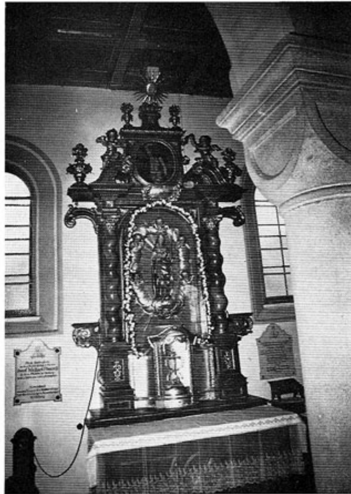
Der Hochaltar der alten Kirche steht jetzt als Marienaltar im Seitenschiff der neuen Kirche. Rechts davon die Gedenktafel an Georg Nöscher.

beschränkten Mitteln ein einfaches Dorfkirchlein gebaut worden sei«. 1903 wurde es wegen der zu hohen Instandsetzungs- und Erhaltungskosten abgebrochen.