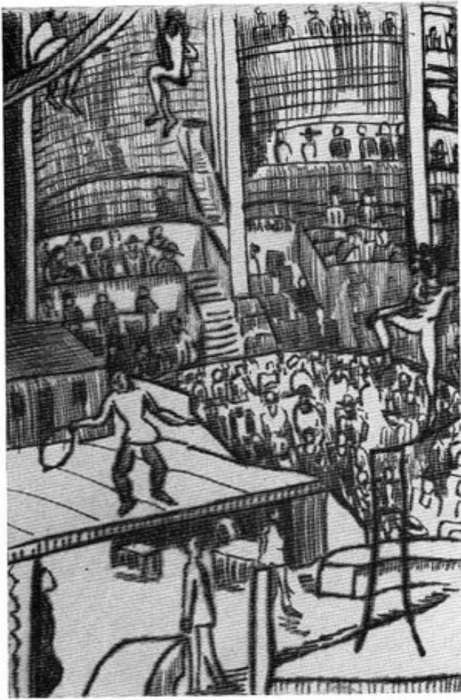
Abb. 4: Paula Wimmer; Zirkus, Radierung 13 x 9 cm