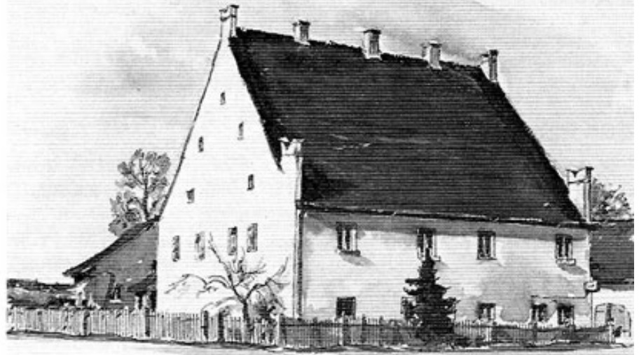
Die Tafernwirtschaft in Erdweg.