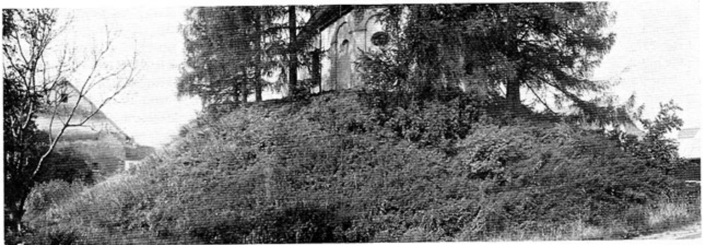
Abb. 5: Heutiger Zustand des Turmhügels Althegnenberg.

Apian , S. 43, 1 u. 35, 27: Högneberg arx in colle. Althögneberg olim etiam arcem habuit (in Hofheggenberg eine Burg. Auf dem Hügel in Althegnenberg stand früher ebenfalls eine Burg). Oberbayer. Archiv 3 (1841) 13. Ohlenschlager , F.: Römische Überreste in Bayern, Heft 1, München 1902, S. 85. Monumenta boica Bd. 7, S. 368. Steichele : Bistum Augsburg. Bd. 2, S. 428.