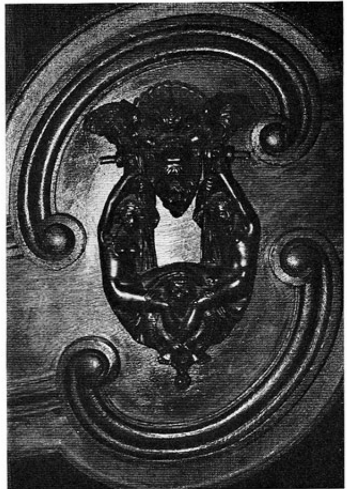
Schloß Haimhausen, Türklopfer