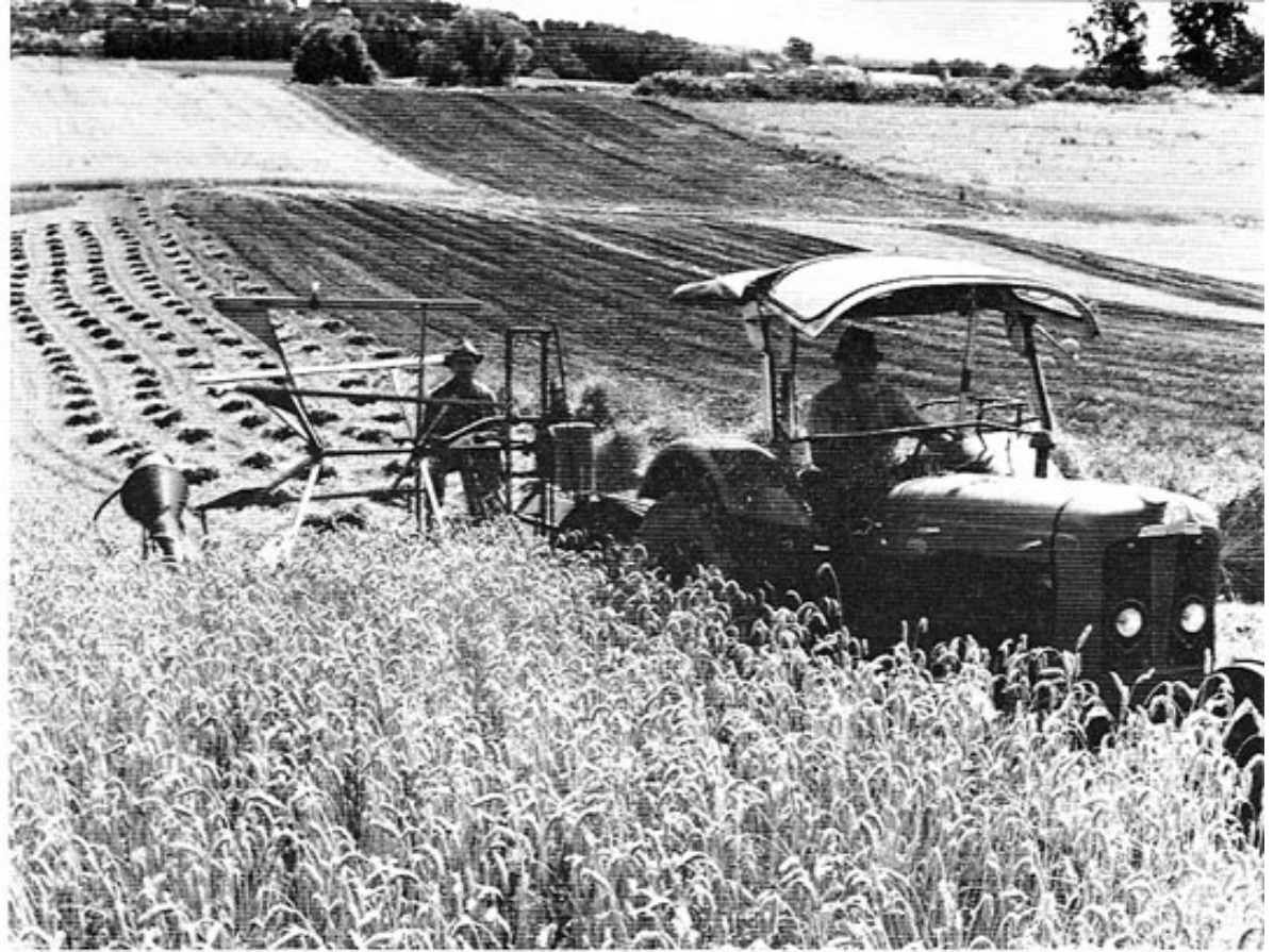
Bäuerliches Land im Norden von Dachau.

Hohe und sichere Erträge vom Ackerland sind die Grundlage des finanziellen Erfolges. Der Dachauer Bauer beherrscht die Produktionstechnik. Wie früher für seine Rösser, so hat er heute viel übrig für die Schlepper-Pferdestärken und alles Maschinelle, selbst wenn es auf Kosten des eigenen Lebensstandards geht. Maschinenkapitalneuwerte in mittleren bäuerlichen Betrieben um 3000.— DM je ha LN sind durchschnittlich, solche um 4000.— DM je ha LN nicht selten. Der soziale Rang, einstmals beim Wirt durch strenge Tischordnung offenkundig, wird heute bewußt durch die eigene Maschine ausgeglichen. Der Zuerwerb irgendwo in der Region München findet hier seinen sichtbaren Ausdruck. Der Maschineneinsatz, insbesondere der überbetriebliche, wird durch die Flurbereinigung erst wirkungsvoll. Die Gemeinden südlich der Linie Hirtlbach, Arnbach, Ried, Sigmertshausen, Unterweilbach, Ampermoching und diese eingeschlossen, haben diese Verbesserung der Agrarstruktur teils schon beendet oder in Angriff genommen.