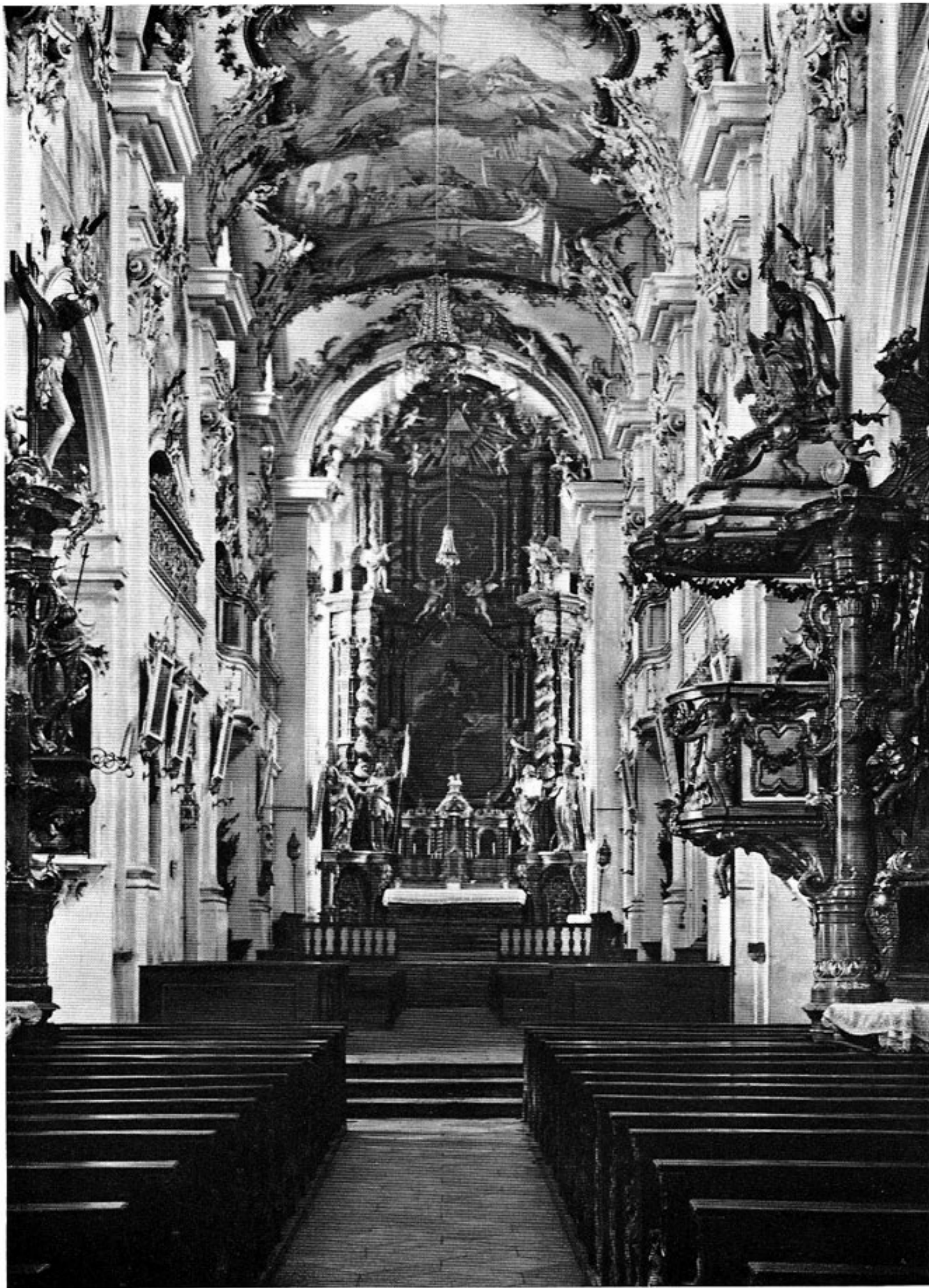
Inneres der Klosterkirche in Indersdorf.