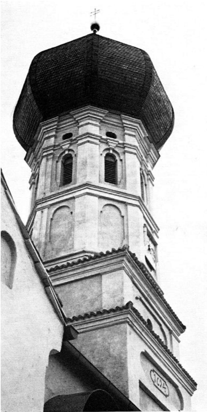
Kirche in Rumeltshausen.

In hoch- und spätgotischer Zeit entstehen dann allenthalben kirchliche Neubauten, Umbauten und Veränderungen der Innenräume (hauptsächlich an den Gewölben). Der vorhergehende Typ der romanischen Dorf-