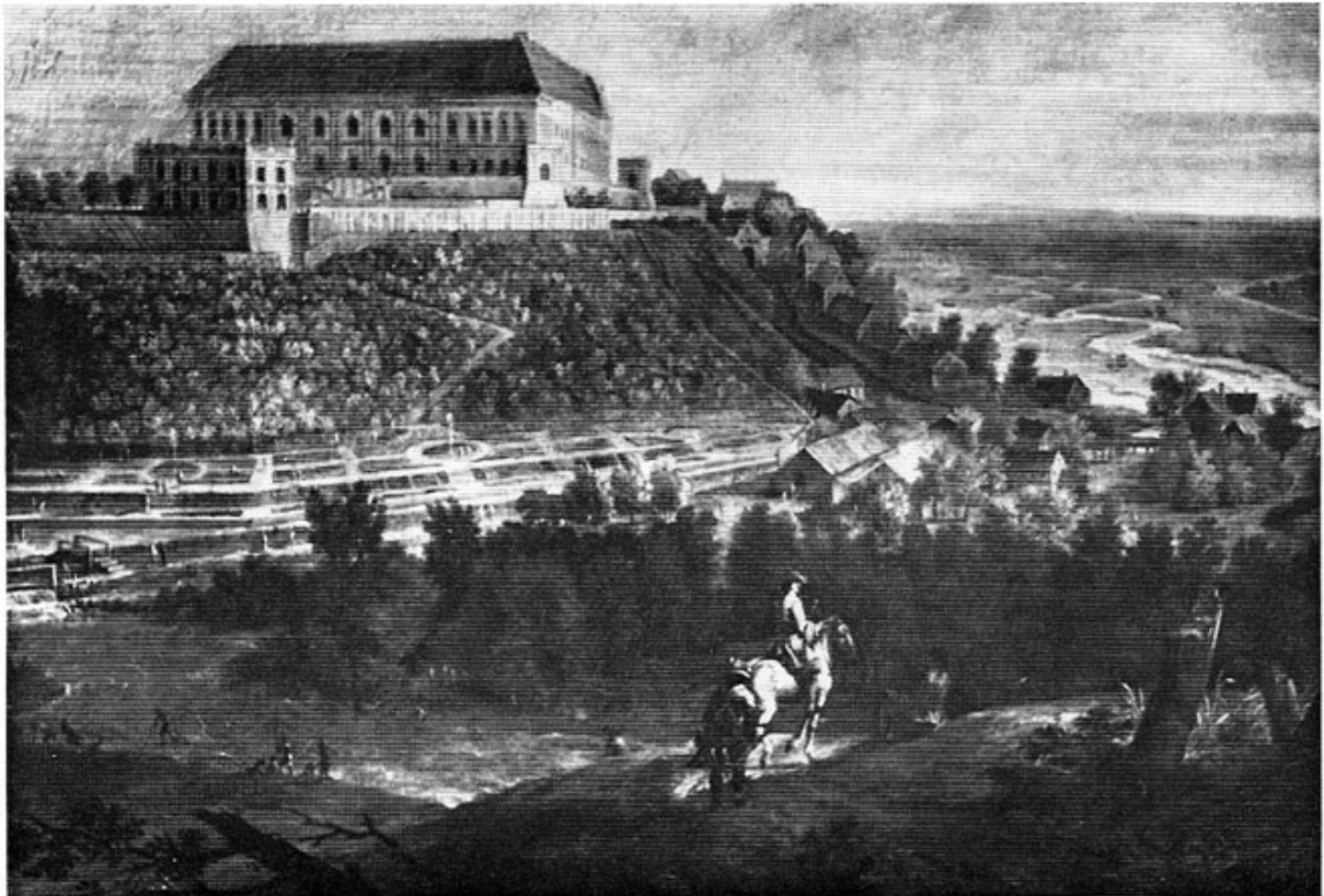
Das Dachauer Schloß nach einem Ölgemälde von Joachim Beich in der südl. Galerie des Schlosses Nymphenburg.

Wenn wir nun danach fragen, wann erstmals in Dachau ein Schloß oder eine Burg errichtet wurde, so ist die Annahme Huschbergs (Älteste Geschichte des Hauses Wittelsbach), bereits um 800 habe in Dachau eine Burg gestanden, weder durch eine Quelle zu belegen, noch wahrscheinlich. In der Schenkungsurkunde der Erchana aus dem Jahre 805 wird nur von einem „Stück Land“ und von fünf Leibeigenen gesprochen, die nun an die Freisinger Bischofskirche kamen. Selbst als zwischen 926 und 937 der Edle Jakob Dachau — u. zw. wahrscheinlich die gesamten dortigen Liegenschaften — vom Freisinger Bischof gegen anderen Grundbesitz eintauschte, gab es in Dachau lediglich einen Herrenhof, sechs Kolonenhöfe, eine Mühle (Steinmühle) und eine Kirche — womit wahrscheinlich nicht die spätere Dachauer Pfarrkirche St. Jakob gemeint ist, sondern, wie auch Fried animmt, die Mitterndorfer Ursparrei. Dachau war also in der Mitte des 10. Jahrhunderts noch eine bäuerliche Siedlung, wie so viele im Dachauer Land. Kübler sagt mit Recht, daß fr ü h e s t e n s der