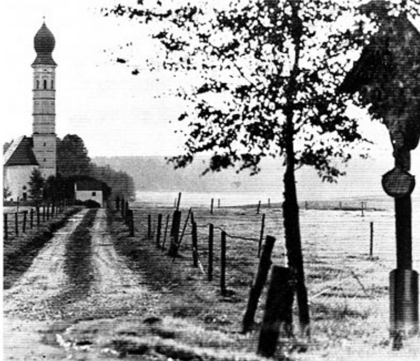
Filialkirche St. Kastulus in Puchschlag.

Dachauer im staatlichen und kirchlichen Leben.