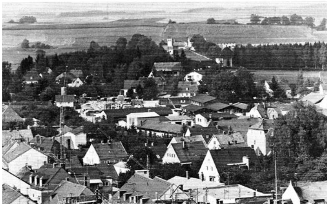
Blick vom Dachauer Schloß ins Hügelland.