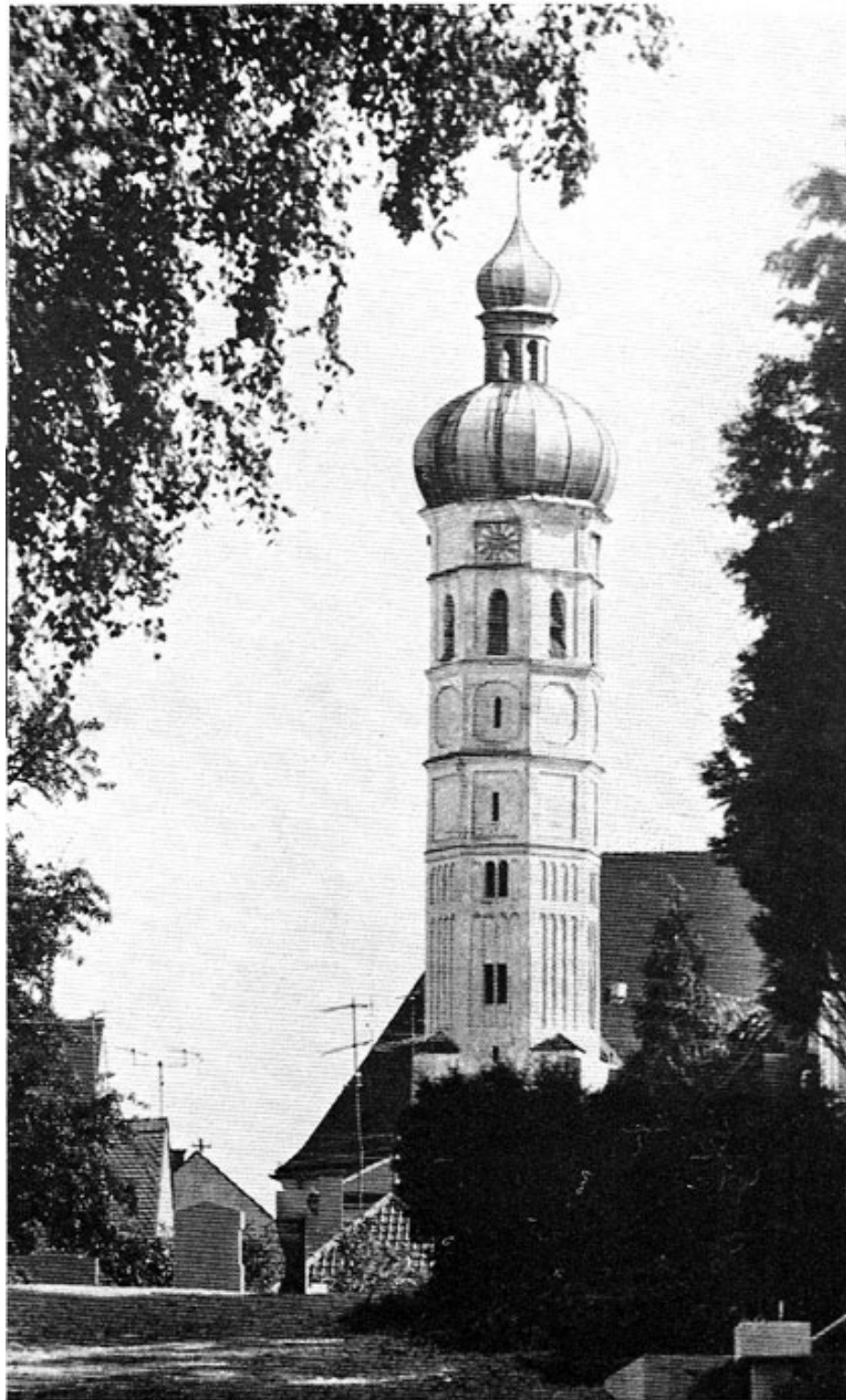
Pfarrkirche St. Jakob in Dachau.