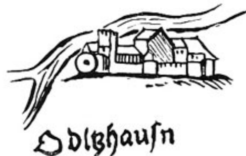
Schloß Odelzhausen nach den Landtafeln.

Nur stattliche Schlösser hat Apian mit dem Attribut „arx permagna et vetusta“ (weitläufiges Schloß mit alter Geschichte) versehen – so auch Odelzhausen. Ihren großen Ausbau hat die Höhenburg unter den Eisenhofern und den bayerischen Herzogen im 14. und 15. Jahrhundert erfahren. Die strategische Bedeutung war gegeben, als die Glonn Grenze zwischen Ober- und Niederbayern war. 1457 ging das Schloß an die Auer von Pullach über, die es zu Apians Zeiten besaßen.