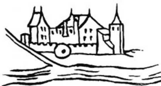
Schloß Weichs an der Glonn.