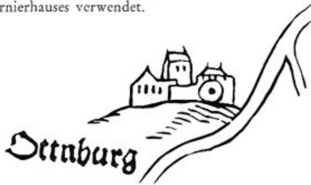
Das fürstbischöfliche Schloß Ottenburg.

Die Anfänge von Kranzberg gehen ins 13. Jahrhundert zurück. Und hatte die Entwicklung der Burg in der ersten Phase noch der Gedanke eines wittelsbachischen Bollwerks gegenüber der bischöflichen Stadt bestimmt, so erfuhr die Anlage ihren wesentlichen Ausbau zur Zeit der Landesteilungen, als das Landgericht Kranzberg zu Niederbayern, das Landgericht Dachau zu Oberbayern kam. Apians Karte zeigt das herzogliche Pflegeschloß. Mächtig heben sich Bergfried und Hauptgebäude heraus. Die wahre Ausdehnung können wir noch heute abschätzen, wenn wir vom anderen Ufer des Flusses den nunmehr leeren Burghügel mit unseren Blicken abmessen. Von der Burg steht nichts mehr seit sie 1632 von den Schweden eingäschert wurde. Die Steine hat man 1660 nach München transportiert und zum Bau eines Turnierhauses verwendet.