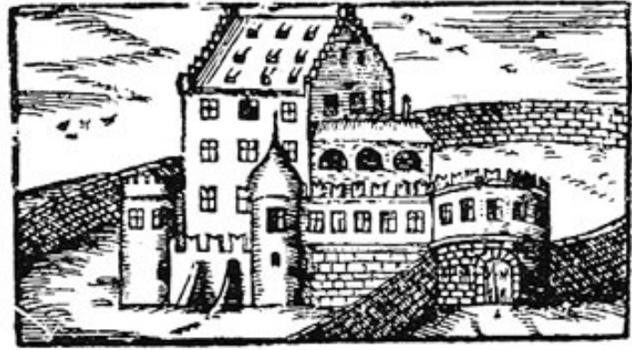
Für die Landesbeschreibung gefertigter Holzschnitt von Eisenhofen.

dem Stamme hervorgehen, unter dessen Vorzügen biedere Treuherzigkeit obenansteht.“ (1899).