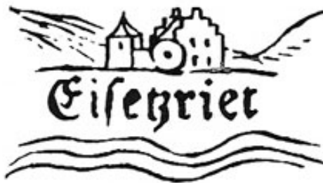
Schloß Eisoldzried an der Maisach.

ging es an die Hundt über, die es noch heute besitzen. Dort findet sich in der Kirche hinter einer Bank in die Wand eingelassen eine schwarze Tafel, die nach dem Abbruch der Münchner Franziskanerkirche von dort hierher gebracht wurde: die Grabplatte des Wiguläus Hundt. Nur mit Mühe können wir sie noch entziffern: „WIGVLEVS HVND A SVLZEMOS ET LENTING IVRISC: NOBILIS BOIVS CVM ANTE MVLTO ANOS AB OPT PRINCIP: BOIOR: WILHELMO ET ALBERTO IN COSILIV ASCITVS ET AB HOC EIVSDEM SVPREMI CONSILII PRAESES CREAT . . . . . POST VARIOS DOMI . . . . . INFOELICITER SVSC . . . . . RES . . . . . ETA . . . . . ME“ Das Schloß hat auch heute seinen Burgencharakter noch nicht verloren, eine letzte Erinnerung an jene Anlage, wie sie Apian noch gesehen hat: ein hohes Haupthaus umgeben von Mauern und Zinntürmen.