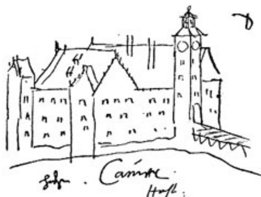
Skizze von Schloß Hohenkammer.

In gutem Zustand fand sich damals das Schloß, „arx permagna“ wie Apian es nennt. Zwei Giebelgebäude waren durch einen Verbindungstrakt zusammengeschlossen. Steile Dächer, Zinnenmauern, umspült von den Armen der Glonn: noch auf Wenings Stich 150 Jahre später bietet sich das gleiche Bild.