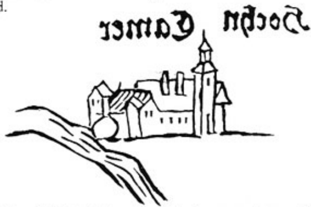
Auf Landtafel 14 findet sich Hohenkammer seitenverkehrt. Das Bild wurde deshalb hier umgedreht.

Von Hohenkammer hat uns der Zufall Apians Skizze erhalten: die Umriss und wesentlichen Bestandteile des vierflügeligen Wasserschlosses in Minutenschnelle auf ein Papier geworfen. Darunter die Worte: „hochn Camer Hasl“. Ecktürmchen, ein Uhrturm über dem Tor, hohe Kamine und die vielfenstrigen Fronten bestimmen das Bild.