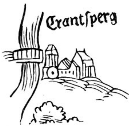
Das herzogliche Schloß Kranzberg mit dem Amperübergang.

Die Anfänge von Kranzberg gehen ins 13. Jahrhundert zurück. Und hatte die Entwicklung der Burg in der ersten Phase noch der Gedanke eines wittelsbachischen Bollwerks gegenüber der bischöflichen Stadt bestimmt, so erfuhr die Anlage ihren wesentlichen Ausbau zur Zeit der Landesteilungen, als das Landgericht Kranzberg zu Niederbayern, das Landgericht Dachau zu Oberbayern kam. Apians Karte zeigt das herzogliche Pflegeschloß. Mächtig heben sich Bergfried und Hauptgebäude heraus. Die wahre Ausdehnung können wir noch heute abschätzen, wenn wir vom anderen Ufer des Flusses den nunmehr leeren Burghügel mit unseren Blicken abmessen. Von der Burg steht nichts mehr seit sie 1632 von den Schweden eingäschert wurde. Die Steine hat man 1660 nach München transportiert und zum Bau eines Turnierhauses verwendet.