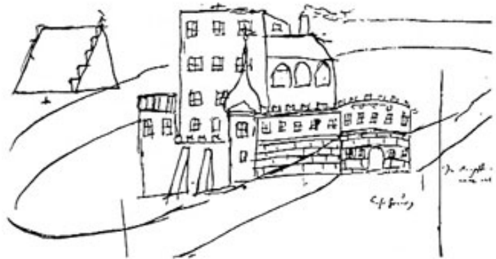
Die erhaltene Reiseskizze von Eisenhofen.

Dieser Oswald von Eck hat Eisenhofen zu einem großzügigen Schloß ausgebaut: „Eisenhofen liegt auf einem Hügel und ist eine hervorragende und stattliche Burg. Der derzeitige Besitzer ist Oswald von Eck, der Sohn Leonhards, der durch viele Gebäulichkeiten die Burg verschönert hat.“ So berichtet Apian.