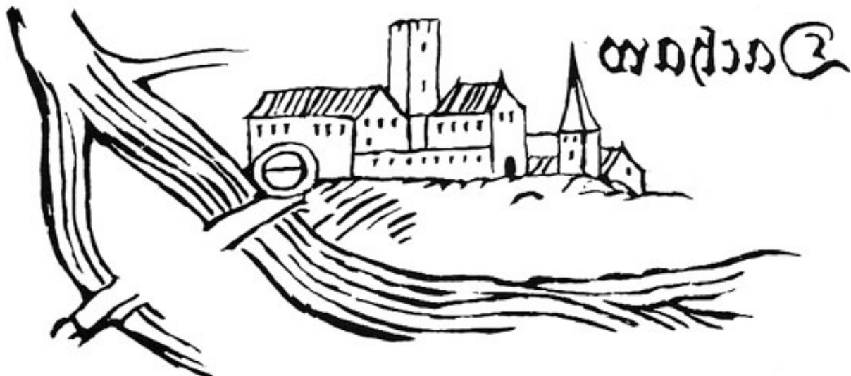
Älteste Ansicht von Dachau, gewonnen durch Umdrehen des Apianischen Bildes.

„Kranzberg ist eine alte und weitläufige Burg in Oberbayern. Es liegt an der Amper auf einem Hügel, 7000 Schritte westlich von Freising.“ Mit diesen Worten beginnt Apian seine Beschreibung des Landgerichts Kranzberg.