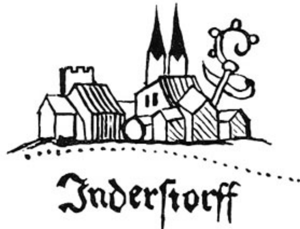
Kloster Indersdorf mit der Landgerichtsgrenze.

Auch das Augustiner-Chorherrenstift Indersdorf erhielt als bedeutender Grundbesitzer und geistliches Zentrum des Hinterlandes von Dachau sein Portrait auf der Karte. An der Grenze der Tafeln 13 und 14 findet es sich – wie Dachau – am linken Rand leicht angeschnitten. Es zeigt noch den Zustand vor Einsetzen der barocken Umbauten unter Caspar Schlaich und Gelasius Morhart. Das künstlerische Interesse in Indersdorf war im 16. Jahrhundert noch nach innen gerichtet: Man vermehrte den Kirchenschatz, ließ eine neue Orgel bauen und erwarb Bücher. Neue Ornate wurden angeschafft und ein heiliges Grab. Die Filialkirchen erhielten neue Ausstattungen. So spiegelt die Klosteranlage noch ganz das allmählich Gewachsene einzelner Gebäude. Wir erkennen die gotischen Turmspitzen, das Kirchendach und den bewehrten