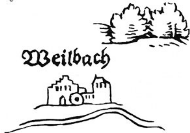
Schloß Unterweilbach vor dem Dreißigjährigen Krieg.

Nur wenig hinter Dachau im ersten Tal des Hügellandes liegt die Hofmark Pellheim. Eine Reihe Münchner Bürgerfamilien finden wir als wechselnde Besitzer. Im 16. Jahrhundert waren es die Ridler und die Tegernseer. Apians Karte zeigt noch die aus zwei Gebäuden bestehende Wasserburg. Pellheims leuchtende Zeiten kamen erst hundert Jahre später, als das Barock in seine Räume einzog.