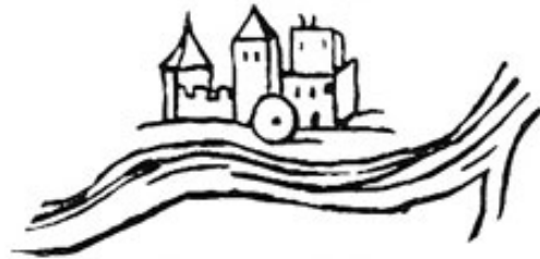
Die Feste Weikertshofen an der Stelle des heutigen Schlosses Unterweikertshofen.

Nach der Feste Weikertshofen an der Glonn nannte sich im 12. Jahrhundert ein edelfreies Geschlecht, das eine Reihe von Freisinger Domherrn stellte. Die Burg kam dann an die Wittelsbacher, die sie als Lehen weiter vergaben. Im 16. Jahrhundert saßen die Adelzhauser auf Unterweikertshofen.