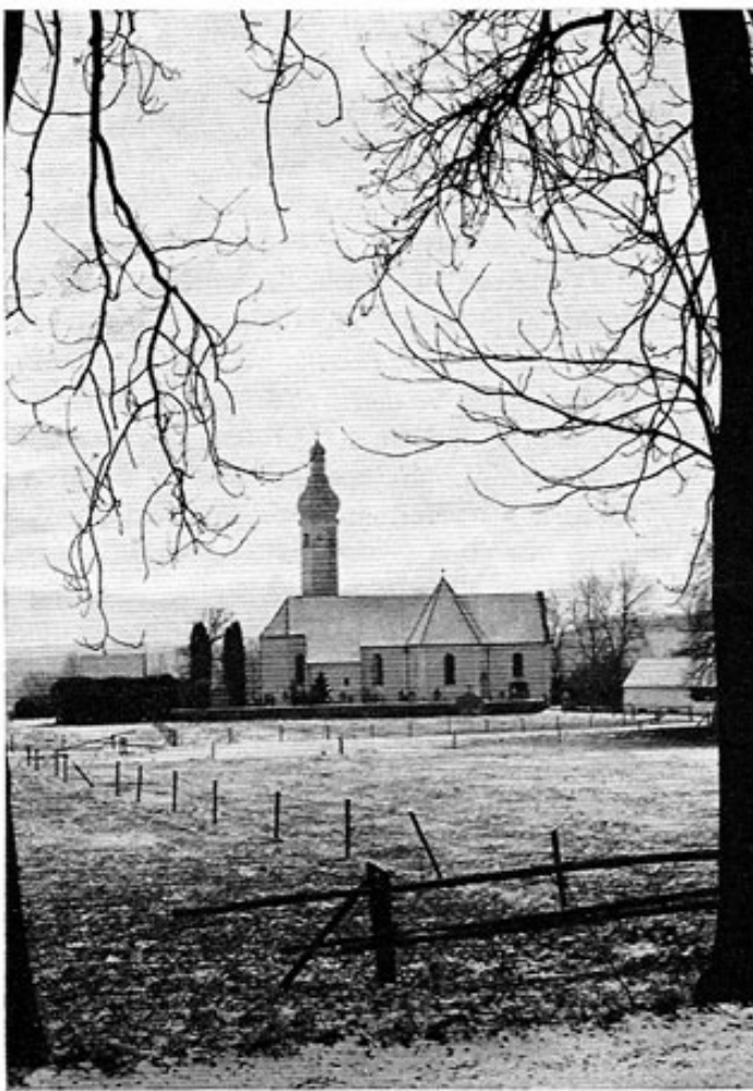
Kirche Unterweikertshofen, von Norden.