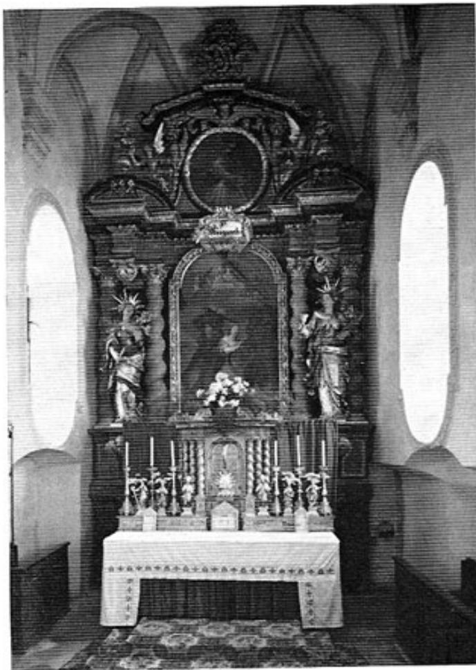
Pfarrkirche Einsbach, Hochaltar.

Hans Maurers Hauptwerk, um das es hier hauptsächlich geht, ist das Oktogon der St. Gabinus-Kirche in Unterweikertshofen. Die höchste Ehre wurde dem Bau und damit dem Maurermeister aus Hirtlbach zuteil, weil der Bau für den berühmtesten Kirchenbaumeister