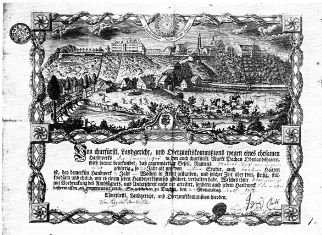
Gesellenzeugnis aus Dachau (1801).

Der Zeit die Franzosen im Zurückmarsch im Markt in das Quartier kamen, so feuerten sie in der Küche bei dem Unterbräu so stark auf, daß sie den Kamin anzündeten. Es war just unter der Kirchenzeit; da ich Feuerlärmen hörte, sprang ich aus der Kirche, schlupfte in mein Arbeitskleid und eilte dem Feuer zu. Da mein Herr schon wirklich bei dem brennenden Kamin stand, eilte ich zu ihm hin, steckte mit einer Straßendun- gert den Kamin zu, sprang auf selbigen und fuhr in Gottes Namen durch den brennenden Kamin. Das Feuer war augenblicklich gelöscht, weil aber von unten- herauf der Kamin entsetzlich weit war, so mußst ich in dem glühenden Kamin wieder zurück herauf. Nur durch Hilfe meines Herrn Meisters kam ich noch bei dem Leben davon; ich verbrannte mir aber in Gesicht, Händen und Füßen so, daß man mich [mit] einer Holz- tragen in das Krankenhaus brachte. Die Einwohner und Handwerksburschen von diesem Ort haben mit mir ein sehr großes Mitleiden und schenkten mir sehr viel Geld. Die Kost aber, derzeit ich krank war, erhielt ich vom Unterbräu, und die Unkosten bezahlten sie auch. Wie ich aber besser wurde, so erhielt ich von der Frau Bräuin zwei neue Kalbfell, denn weil ich mein Ruß- gewand ganz verbrannt habe, ein Douceur in baarem Geld von 77 Gulden, und das, was ich von die übrigen