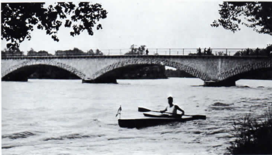
Die 1948 erbaute Freisinger Isarbrücke.