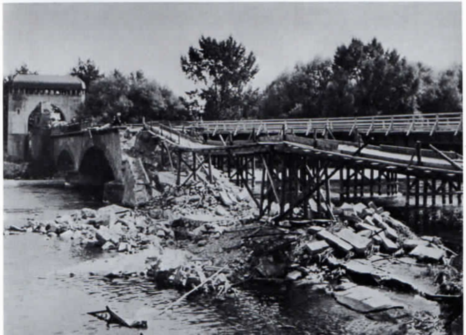
Die im Jahre 1945 zerstörte Freisinger Isarbrücke von 1894.