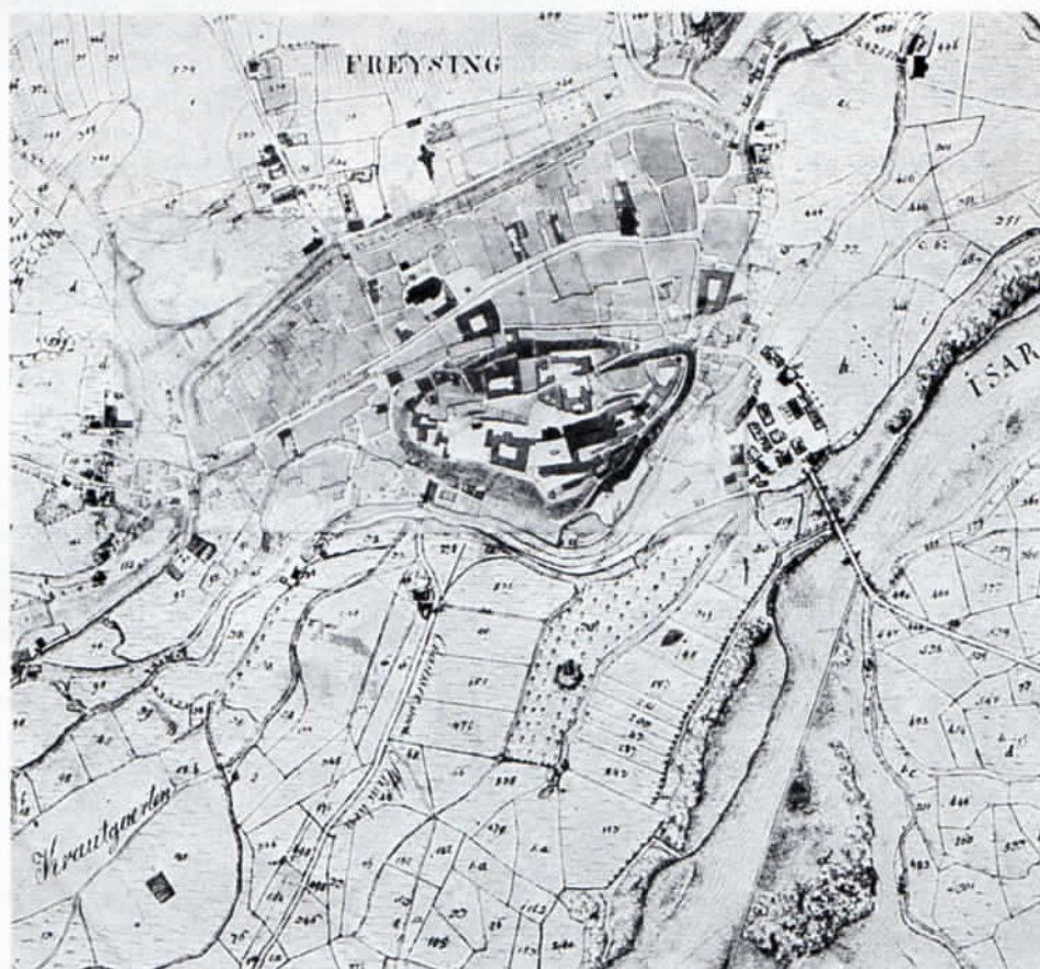
Isarübergang bei Freising im Jahre 1810. Ausschnitt aus dem Katasterblatt.

Freising erhielt 1722 von der kurfürstlichen Verwaltung etliche Eichenstämme, doch war mit bloßen Reparaturen auf die Dauer kein bleibender Erfolg zu erzielen. Endlich kam Ende September 1722 durch allerhöchste Anordnung – von der Hofkammer ausgehend, unter Einschaltung des Obersten Jägermeisteramtes und der Forstmeisterämter Dürnbuch und Neustadt – die Auslieferung von 100 Eichen für den neuen Brückenbau in Bewegung, doch verfloß bis zur Fällung und Lieferung