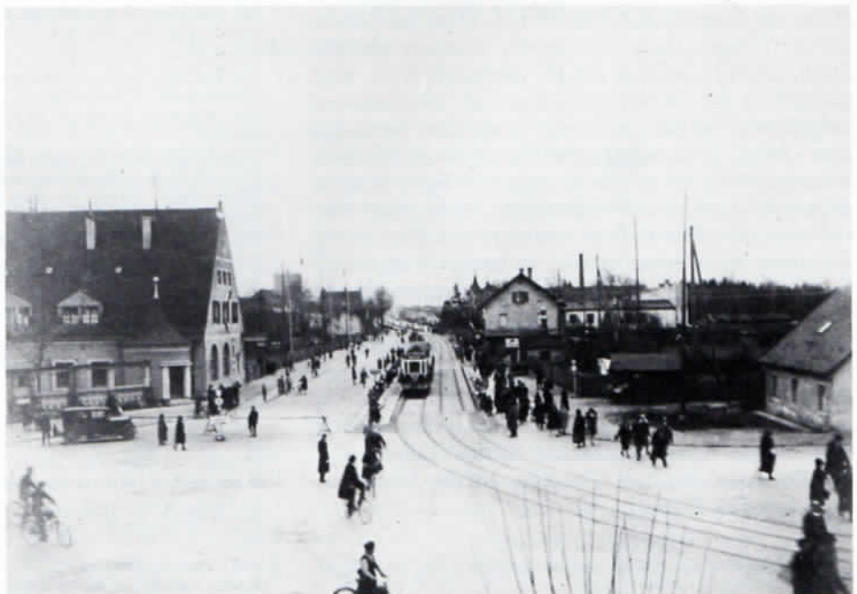
Straßenbahn nach Moosach, Kreuzung Dachauer Straße/ Pelkovenstraße/Pasinger Straße im Jahre 1930. Links der »Alte Wirt«.