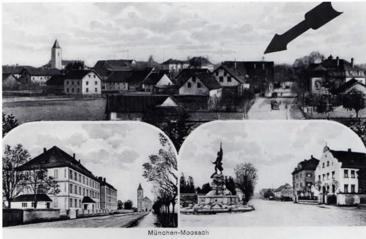
Postkarte von Moosach aus den 1930er Jahren. Der Pfeil weist auf den »Alten Wirt«.