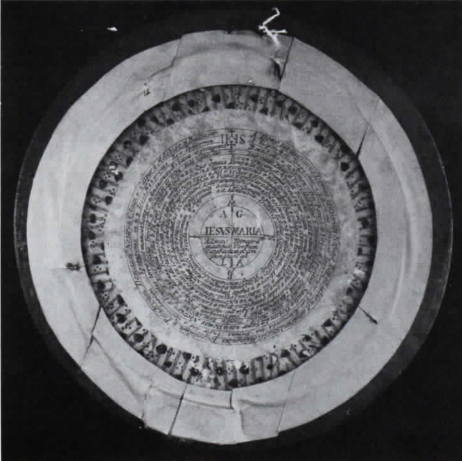
Rückseite des Wettersegens aus dem Bestand des Museumsvereins Dachau, Inv. Nr. RV 454.