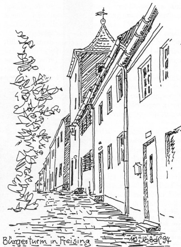
Der Bürgerturm in Freising. Federzeichnung von Willi Böck, 1994.