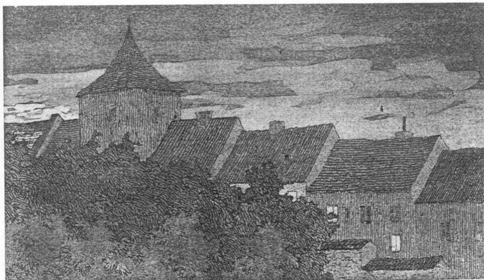
Der Bürgerturm in Freising. Radierung von Alois Illinger, um 1925.

Diese Sitzung brachte überhaupt große Veränderungen für den Bürgerturm mit sich. So beschloß man, »den Bürgerturm für die Folge nicht mehr bewohnen zu lassen«. Der Tagelöhner Widmann und seine Frau sollten in der Armenherberge oder in der Gesindestube des Heiliggeistspitals aufgenommen werden. Den Tagelöhner Paul Schwaiger wollte man mit seiner Familie »veranlassen, eine Privatwohnung zu mieten und im Falle der Hilfsbedürftigkeit bei der Armenpflege um Gewährung eines Wohnungsgeldbetrages einzukommen«. Weiter heißt es in dem aufschlußreichen Protokoll: »Bei dieser Beschlufassung geht der Magistrat von der Erwägung aus, daß hinsichtlich des Bürgerturmes nicht nur die Reinlichkeitsverhältnisse, sondern auch die Sicherheitsverhält-