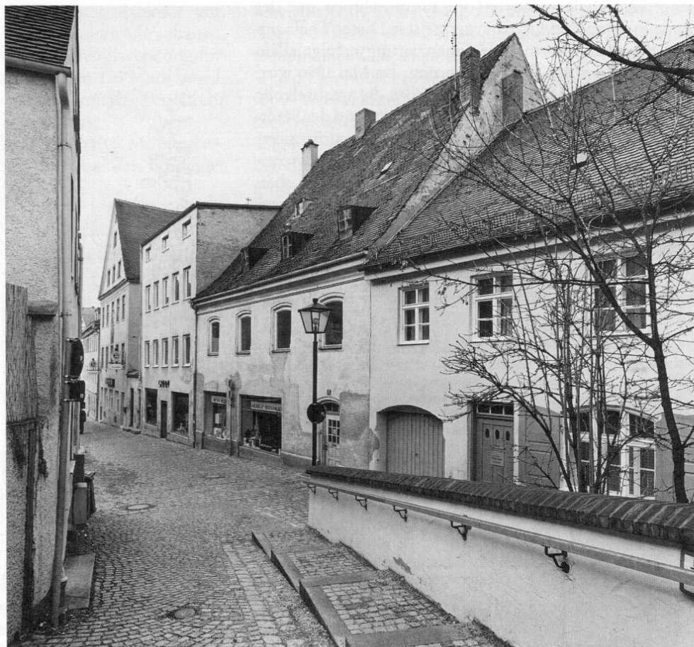
Abb. 1: Freising, Obere Domberggasse, nördliche Bebauung, von Südosten. In der Mitte das Haus Nr. 5 vor der Renovierung, links davon mit flachem Pultdach das Haus Nr. 3.

bau. Die bis 1991 vorhanden gewesenen profilierten Leibungen der Stichbogenfenster und das leider ebenfalls der Vereinfachung zum Opfer gefallene profilierte Traufgesims hatten der Fassade das Gepräge des sogenannten Maximiliansstils des 3. Viertels des 19. Jahrhunderts verliehen (Abb. 1 und 2). Das unverändert erhaltene, jetzt allerdings mit zusätzlichen Dachgauben bestückte steile Satteldach zeigt eine wesentlich frühere Bauzeit für dieses Haus an, vermutlich die Zeit um 1700. Das Gebäude