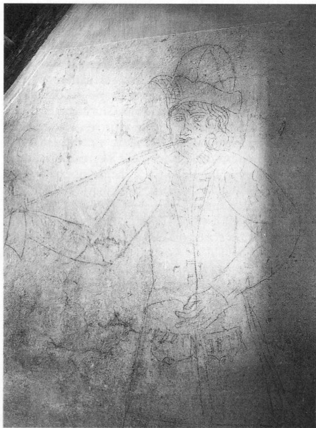
»Der Pfeifenraucher«. Barocke Rötelzeichnung im zweiten Obergeschoß des Bürgerturms.