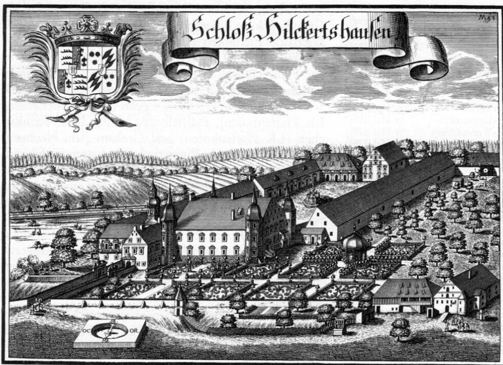
»Schloß Hilckertshausen«. Kupferstich von Michael Wening, 1701.

schenhausen auf 34 Gulden. Letzteres war mit seinen 18 Anwesen deutlich kleiner als Hilgertshausen, dafür aber ein sogenanntes Allod. 20 Die Lehensabgabe für Hilgertshausen erscheint in unserem Verzeichnis leider nicht.