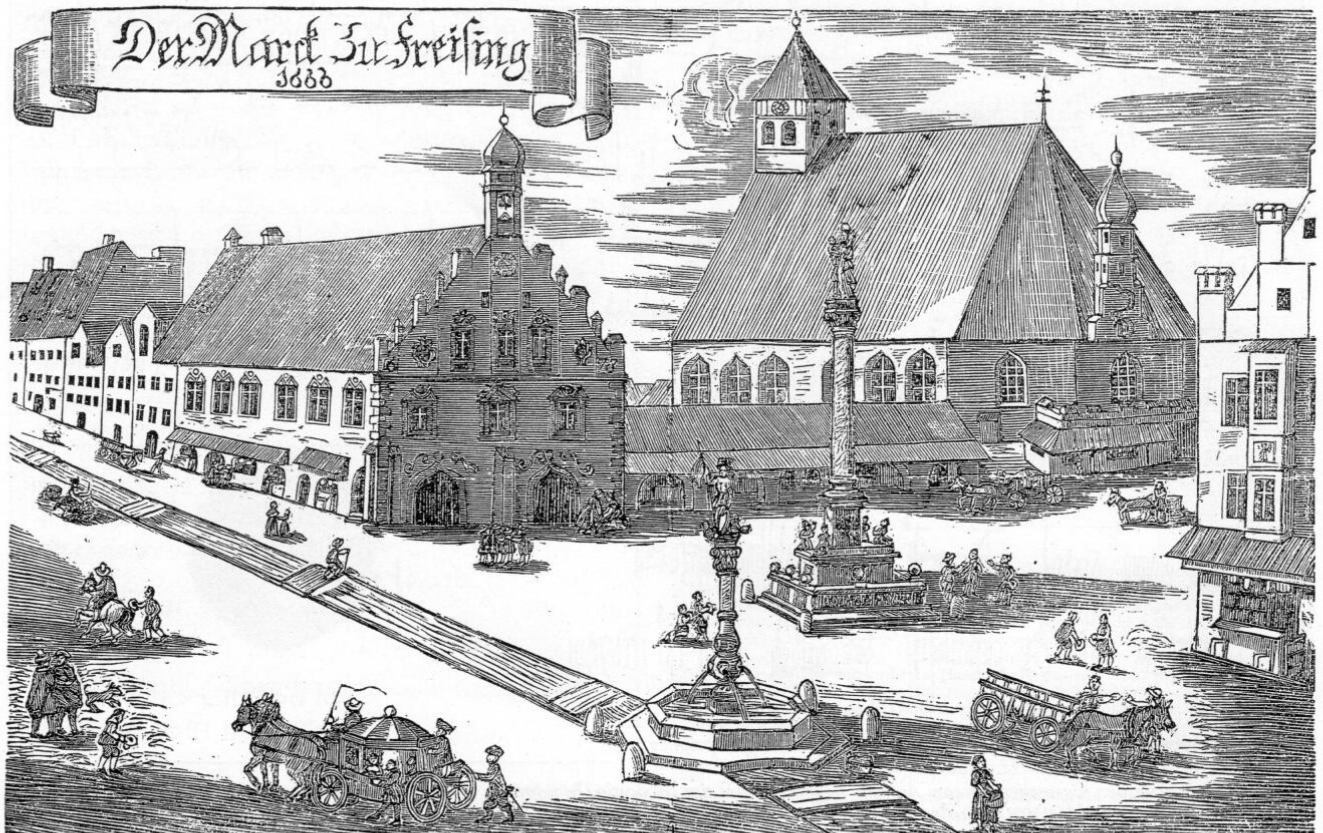
Der Markt zu Freising. Kupferstich von Michael Wening aus dem Jahre 1681, hier fälschlicherweise datiert 1666 (Original im Stadtarchiv Freising).

Mit der berühmten und oft zitierten Kaiserurkunde Friedrich Barbarossas von 1158, die es dem Bayerischen Herzog ermöglichte einen neuen Markt zu errichten, war die Politik der Freisinger Bischofskirche gescheitert, Handel und Gewerbe ausschließlich im Raum des Bistums zu konzentrieren. Der sehr beträchtliche Salz- und Warenhandel aus dem Salzburger und Reichenhaller Land zog nun nicht mehr über Föhring, Handel und Handwerk des mittelalterlichen Freising waren überwiegend auf den Bedarf der fürstbischöflichen Hofhaltung angewiesen und ausgerichtet.