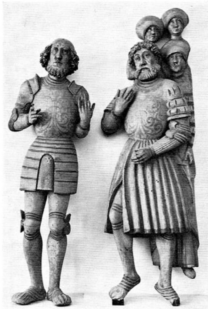
Reste des Stiftergrabes, heute im Bayer. Nationalmuseum, München.

Kurz vor seinem Tode bestimmte Herzog Ludwig in seinem letzten Willen, daß sein Leichnam in dem von ihm gestifteten Kloster Fürstenfeld beigesetzt werden solle. Als er dann am 1. Februar 1294 in seinem Residenzschlosse zu Heidelberg die Augen geschlossen hatte, wurde sein Körper nach der damals üblichen Sitte ausgeweidet, so daß man die Knochen in einer Kiste leicht über eine größere Strecke befördern konnte. Über Einzelheiten der Bestattungsfeier sind wir nicht unterrichtet. Wir wissen aber, daß entsprechend dem letzten Willen neben der Klosterkirche eine besondere Begräbniskapelle für den Herzog und die Angehörigen seines Hauses errichtet wurde. Wie dieses Mausoleum ausgesehen hat, ob es eine schlichte gotische Kapelle oder ein Rundbau war, ist uns nicht bekannt. Wir wissen lediglich, daß sie im Garten des Klosters stand und daß am Todestage des Herzogs in jedem Jahre in dieser Kapelle ein feierliches Totenamt gelesen wurde. Für diesen Zweck hatte der Herzog eigens einen Kelch geschenkt, der auch mehrere hundert Jahre benutzt worden ist, bis er dann im Jahre 1803 an die Münze zu München abgeliefert werden mußte und dort im Feuer zerschmolz.