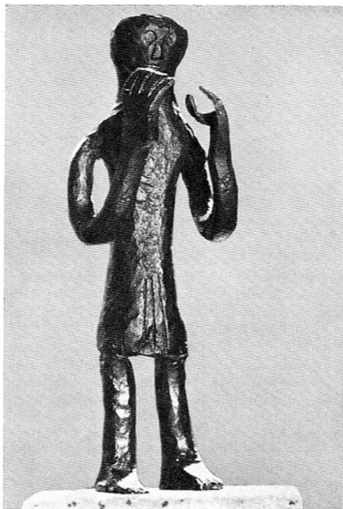
Eiserne Votivfigur (Größe etwa 50 cm, Gewicht 30 kg)

An der Existenz seiner Person ist kaum zu zweifeln, da er schon frühzeitig urkundlich erwähnt wird. Er stammte aus einer adligen Familie, lehnte aber die Übernahme eines geistlichen Amtes ab. Er zog sich in einen Wald bei Limoges zurück und gründete hier mit mehreren Gleichgesinnten ein kleines Kloster, dessen Vorsteher er wurde. Auf den Reisen des Königs durch das Land, zu denen er genötigt wurde, galt sein besonderes Anliegen den