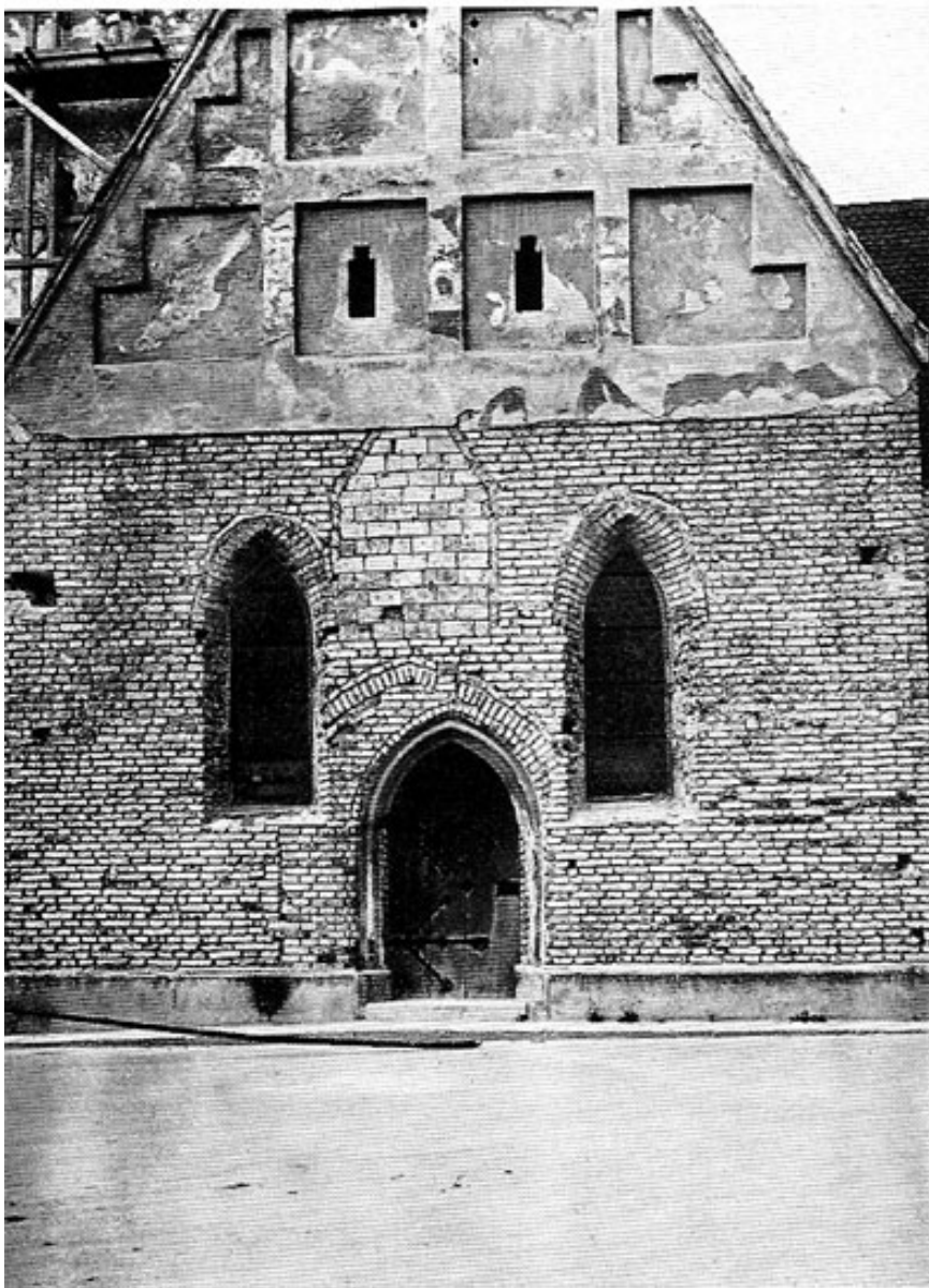
St. Leonhardskirche in Fürstenfeldbruck während der Renovation