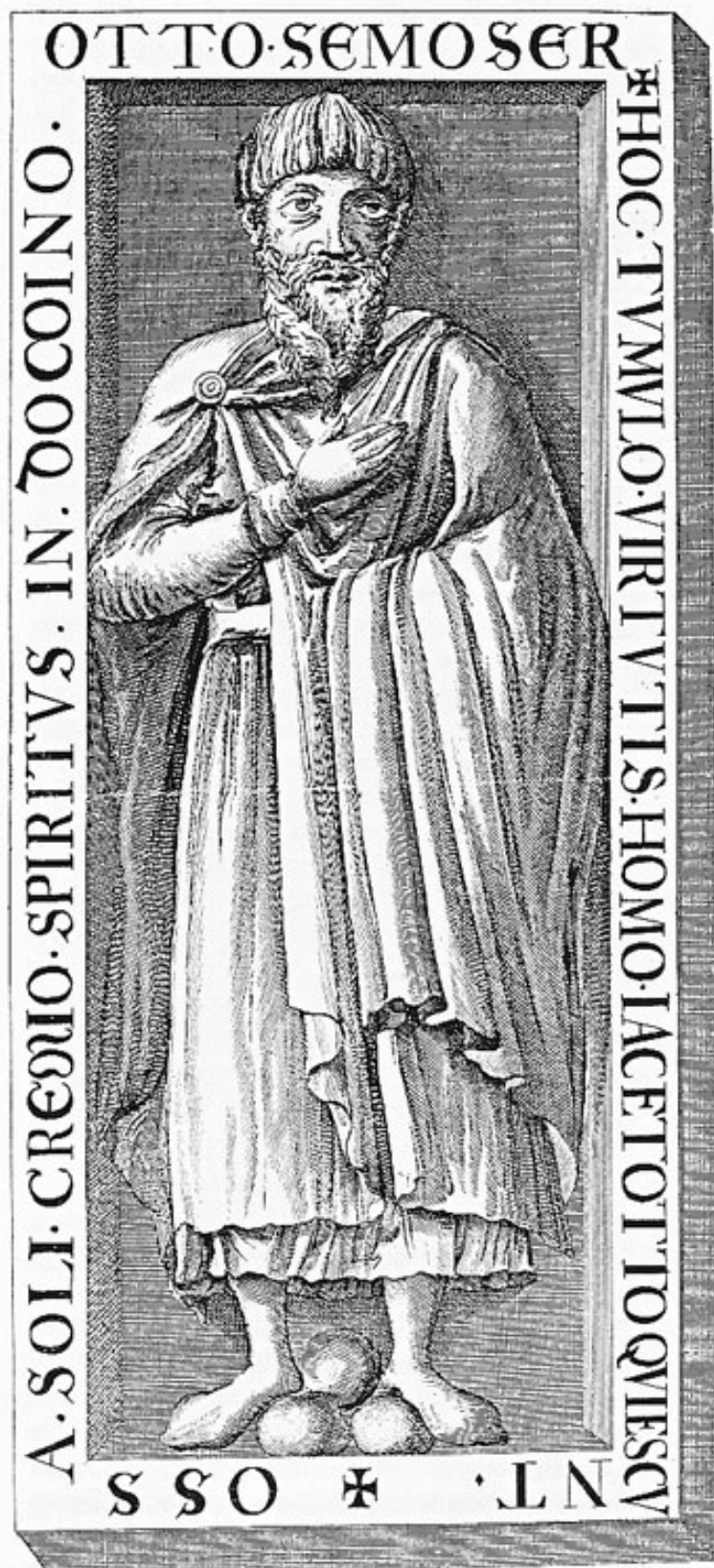
Abb. 2: Kupferstich des Grabsteines von Otto Semoser aus dem 2. Band der »Historia Frisingensis« des Geschichtsschreibers Carolus Meichlbeck, Augsburg 1729.