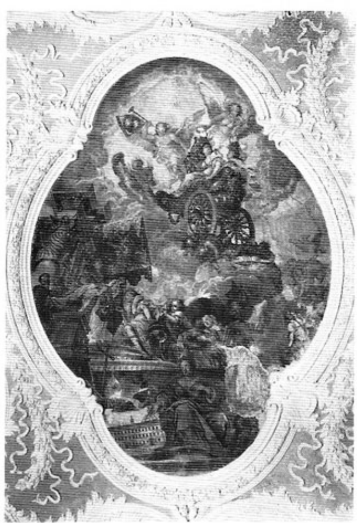
Hans Georg Asam: Virtus et Scientia — Deckengemälde im Asamsaal in Freising.

Für die Laufzeit des Vertrages hatte die Stadt mit dem Kinoinhaber vereinbart, daß die Stadt und die hiesigen Schulen für jeweilige Festveranstaltungen sowie die Asamgemeinde für Theateraufführungen und Konzerte das Benutzungsrecht haben. Als nach zehnjähriger Laufzeit der Vertrag endete, wurde der Saal wieder seinem eigentlichen Zweck zugeführt.