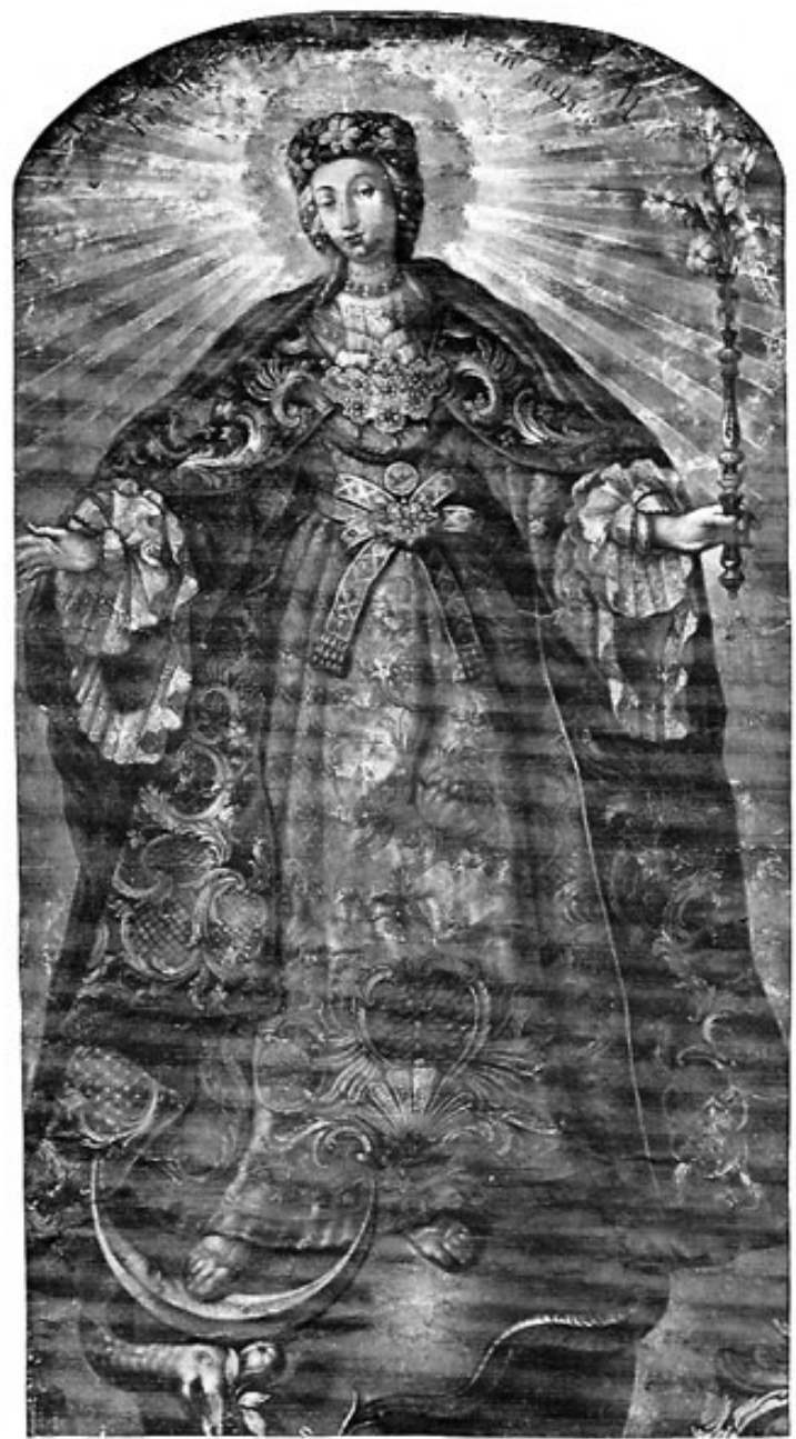
Gnadenbild der Freisinger Immakulata (Schabbild im Freisinger Heimatmuseum).