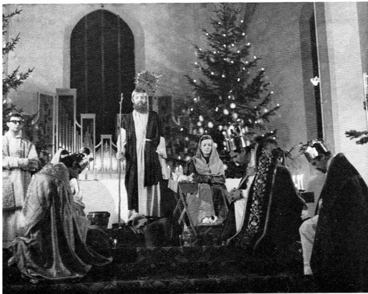
Die Weisen aus dem Morgenland verehren das Christkind.

Großes Gewicht wurde auf die Musik gelegt. Sie sollte den weihvollen Charakter des Spieles unterstreichen und das Publikum zur Betrachtung anregen. Da die Neumen der Freisinger Handschriften unlesbar sind, mußte auf die Melodien der französischen Spiele zurückgegriffen werden 19 . Ferner wurden Gesänge aus der römischen Liturgie und mittelalterliche Organa einbezogen. Mit viel Einfüh-