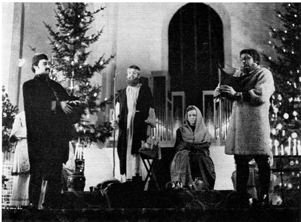
Die Hirten musizieren an der Krippe mit Dudelsack und Vasentrommel.