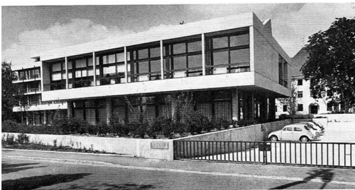
Die neue Postschule von Süden; im Vordergrund das Schulgebäude.

Eine noch so gründliche und umfassende Ausbildung genügt jedoch heute nicht mehr, um dem Auszubildenden das notwendige Rüstzeug für sein ganzes Berufsleben mitzugeben. Die fortschreitende technische und wirtschaftliche Entwicklung, der sich die DBP durch Rationalisierung, Mechanisierung und Automatisierung anpassen mußte, um die Post- und Fernmeldedienste leistungsfähig und zugleich wirtschaftlich zu erhalten, verlangt in zunehmenden Maße