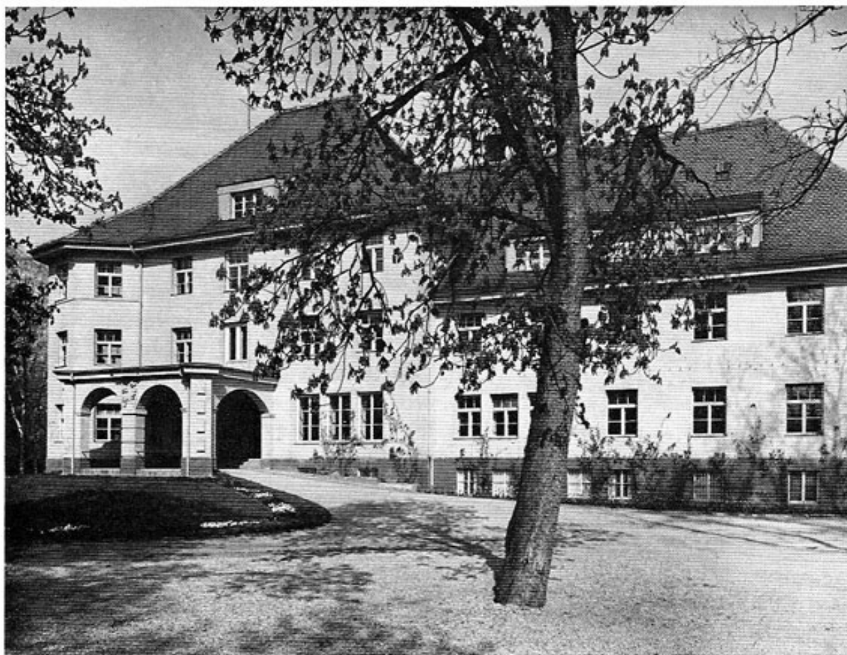
Die Postschule in Dachau nach dem Umbau 1952/53.

Für einen so großen Dienstleistungsbetrieb wie die Deutsche Bundespost, die gegenwärtig mehr als 470 000 Menschen beschäftigt, spielt die Sorge um den Nachwuchs eine bedeutende, ja lebenswichtige Rolle. Ihn sorgfältig auszuwählen und gründlich auszubilden, ist ihre vornehmste Pflicht. Sie kann ihre vielfältigen Aufgaben nur dann erfüllen, wenn