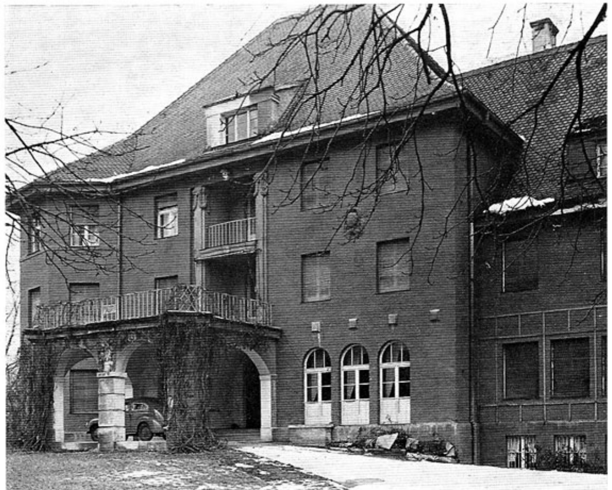
Das Dachauer Moorbad im Jahre 1951.

Der Oberpostdirektion München, die seinerzeit auf der Suche nach einem geeigneten Gebäude zur Einrichtung einer Postschule war, wurde das Moorbad am 16. Februar 1951 zum Kauf angeboten. Nach kurzen Verhandlungen wurde das 14 071 qm große Grundstück samt Gebäudeteilen und Inventar am 13. April 1951 zum Preis von rund 400 000 DM von der Deutschen Bundespost erworben.