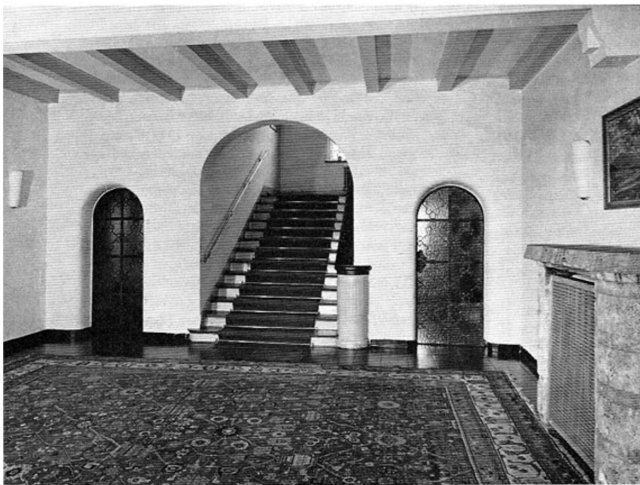
Blick in die Eingangshalle der Postschule in den Jahren 1953—1969.