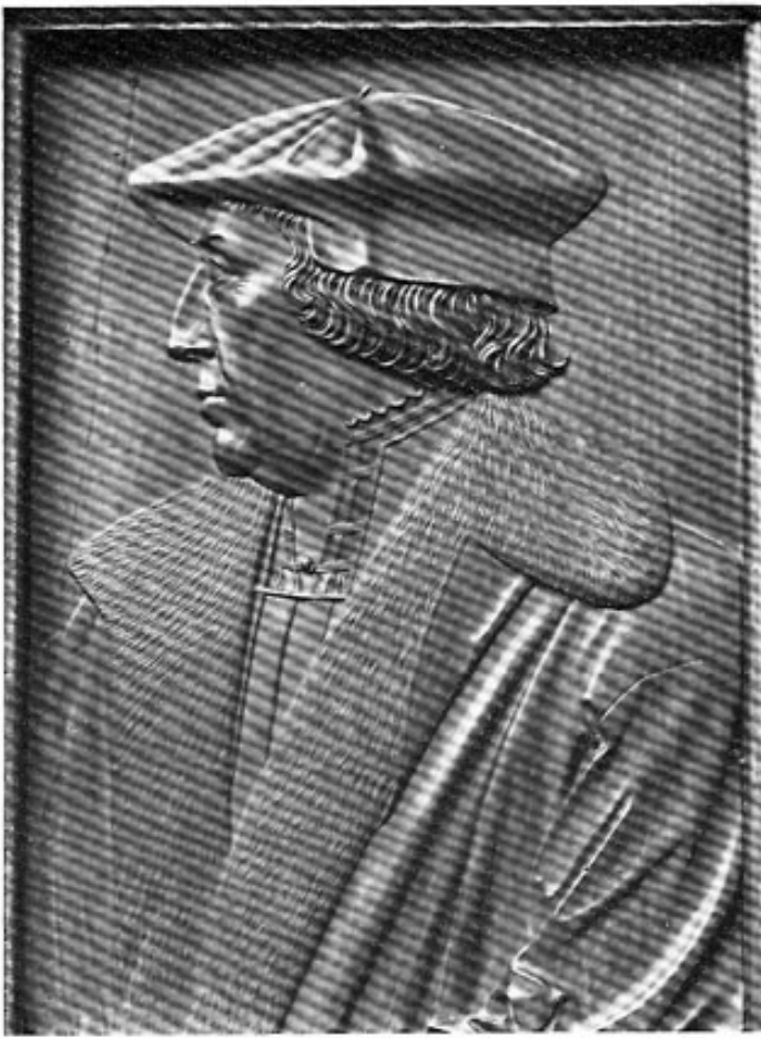
Philipp von der Pfalz, Bischof von Freising. Holzrelief von Friedrich Hagenauer um 1526, Berlin, ehem. Staatliche Museen.