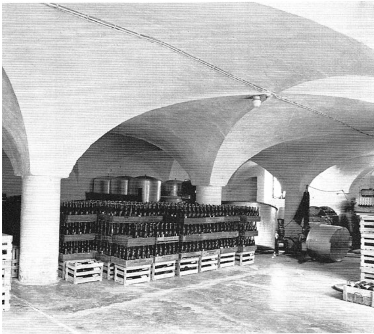
Westliche Halle mit schweren Rundsäulen der Renaissance im Schloß Bischof Philipps am Domberg zu Freising